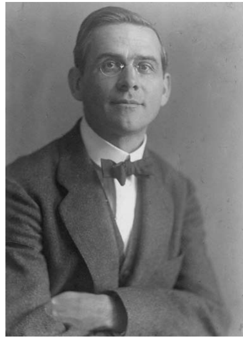
Der Philosoph und Physiker Moritz Schlick. Er wirkte in den 1920-ern an der Universität Rostock.